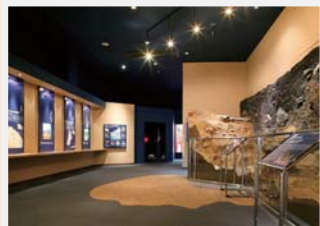
和田峠に近い星黄峠にある黒曜石体験ミュージアム。黒曜石の採掘跡見学や、石器・勾玉作りが体験できる

乱れるお花畑に出会うことができ。10月の紅葉の見事さはあまり知られていないが、レンゲツツジや草紅葉が湿原を彩り、車山のインタープリター(自然案内人)は、大人の景観と名付けている。