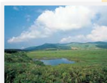
車山からの散策途中で眺める八島ヶ原湿原