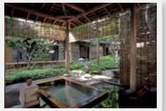
中山道沿いにある下諏訪の宿で湯浴みを

ビーナスラインの玄関口、諏訪湖畔に湧く上諏訪温泉・下諏訪温泉。ともに街道時代からの名湯だが、なかでも上諏訪温泉は、千人風呂