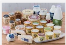
長門牧場の乳製品。ストレスのない環境で育った乳牛から搾る生乳は脂肪分も高く、濃い

川魚やうなぎ料理が有名。とくに「寒の土用丑の日」の弁祥の地として知られる岡谷市では、秋冬に脂がのった「寒うなぎ」も味わえる。