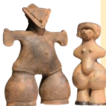
縄文のビーナス(右)は縄文時代の遺物としては初の国宝。仮面の女神(左)も国宝に指定され、茅野市尖石縄文考古館で一般公開されている。