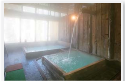
奥蓼科温泉郷の一軒宿、渋・辰野館の内湯「信玄の薬湯」。21.2度の単純酸性冷鉱泉で胃腸病や婦人病に効能あり

軽井沢と並び称される避暑地、蓼科。だが最大の違いは、温泉の多様さにある。日帰り入浴可能な宿や施設も多く、ドライブ途中に気軽に立ち寄れるのもいい。その蓼科でまず訪れたいのが、滝ノ湯川沿いに源泉が湧く蓼科温泉。武田信玄が兵の傷を癒したと伝わる親湯、滝の湯、蓼科三室源泉などの総称で、いずれも湯量豊富。同じ信玄の隠し湯といえは、奥蓼科温泉郷もそのひとつ。渋川の渓谷