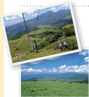
リフトを乗り継げばあつという間に標高1925mの車山山頂