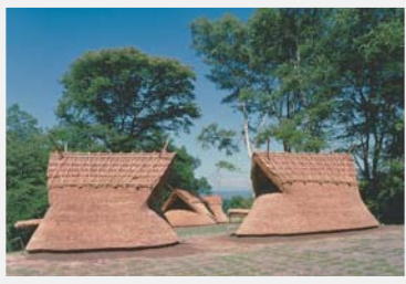
茅野市尖石縄文考古館に隣接する与助尾根(よすけおね)遺跡では、縄文時代の復原住居も見られる

かつて八ヶ岳山麓は、縄文人のパラダイスだったようだ。その証拠に、茅野市街北東に位置する棚畑遺跡からは、肉感的な女性の姿をかたどった土偶が出土。その愛称は、「縄文のビーナス」。奇しくもビーナスラインと同じビーナス、つまり女神の名が付けられているのだ。さらに同市の中ツ原遺跡からは、「仮面の女神」も出土。これらはおもに安産や子孫繁栄を願う祭祀に使われたとの説もある。