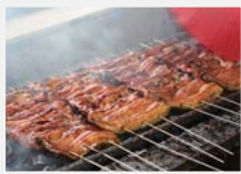
岡谷のうなぎは、背開きにしたうなぎを蒸さず、香ばしく焼く。濃いつけが特徴だ

多いが、当地にはグルメ派にもおすすめの名店が目白押し。蓼科なら山菜、鹿や猪、野鳥などのジビエ、天然キノコなどをフレンチに仕立てるオーベルジュ エスポワールは、舌の肥えた別荘族もうならせる味。また八ヶ岳山麓は高原野菜が名物のひとつで、自家菜園で育てた地場の野菜を出すこだわりの店も。さらに諏訪湖畔では、