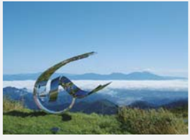
美ヶ原・牛伏山の東斜面を利用し、自然と一体となった美ヶ原高原美術館

沿線に野外美術館があるビーナスライン。そのひとつが終点の標高2000mに位置する美ヶ原高原美術館だ。4万坪の屋外展示場には、国内外の彫刻作品約350点が点在。蓼科湖近くにある蓼科高原芸術の森彫刻公園も2万坪の敷地に約70点の作品が展示され、壮大なアート散歩が楽しめる。