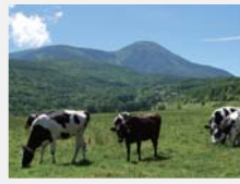
牛や馬が放牧された蓼科第二牧場(上)。白樺リゾートにある黄金アカシアの丘には展望リフトも完備(右)